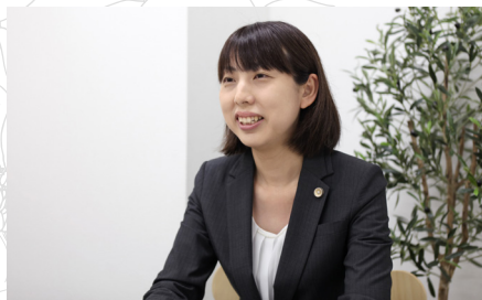
HINAGIKU LAW OFFICE

あなたらしい笑顔を取り戻せるように、そして10年先も笑顔でいられるように、一緒に新しい一歩を踏み出しましょう。