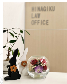
HINAGIKU LAW OFFICE